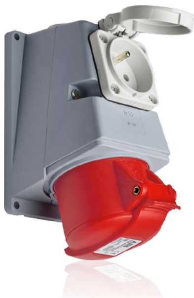
Nová pětikolíková nástěnná zásuvka 400 V s vestavěnou 2pólovou kolíkovou zásuvkou 230 V

Umístění zásuvky jednofázové přímo na těle zásuvky třífázové zjednodušuje a urychluje montáž tam, kde jsou oba typy zásuvek požadovány. Tato dvojkombinace odstraňuje potřebu vytváření „vývodů bokem“, nebo jiného (v některých případech nebezpečného) způsobu připojování jednofázových spotřebičů do zásuvek na 400 V, se kterými se můžeme poměrně často setkat.